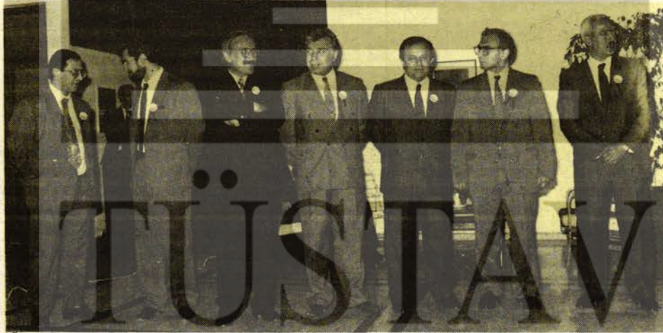
Üstte Yapı-Sen yöneticileri, altta Bank-Sen son Genel Yönetim Kurulu

1978, BANK-SEN'in çığ gibi büyüdüğü yıl oldu; TEKNİK-İŞ (Büro ve Eğitim İşçileri Sendikası), AB-SEN (Anadolu Bankası İşçileri Sendikası), ULUS-SEN(Uluslararası Endüstri Ticaret Bankası), BANK-SEN'e katılma kararı aldılar. Daha sonra Milli Aydın Bankası (Tariş-Bank), Türkiye Bağcılar Bankası, İmar Bankası, Şekerbank, Denizli İktisat Bankası(İktisat Bankası), Güneş Sigorta, Başak Sigorta çalışanları, Sümerbank mağazası ve Ziraat Bankası yemekhane çalışanları ile birçok büro ve işyerinde çalışan emekçi BANK-SEN'e üye oldular.